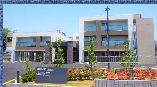
8月1日 畑沢へ引越しました！